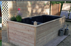
Arbeiten mit Holz